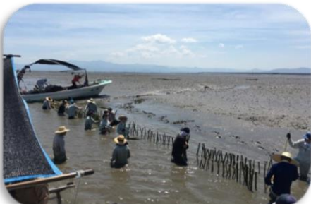
兵庫竹林の活用と保全（除伐竹の有効利用： 蛎礁として活用）／NPO法人嘉瀬川交流軸