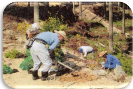
赤瓦の里山集落地域環境改善広葉樹 植栽事業／上無津呂地区（富士町）