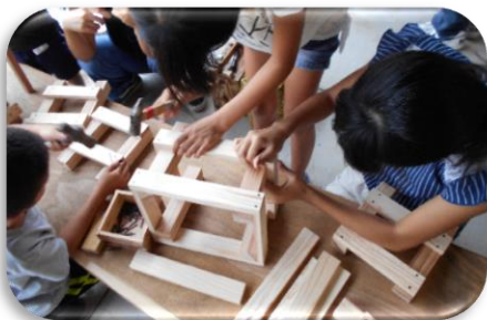
森林・林業及び木材の魅力学習事業（木工 教室等）／東黒川林業研究グループ